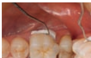
5. fixarea coroanei și îndepărtarea excesului de material