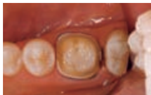
2. dinte preparat pentru aplicarea coroanei