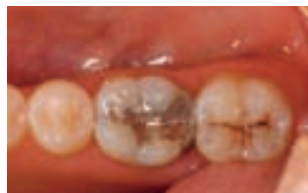
1. estaurare fracturată din amalgam