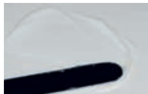
3. dozare și amestecare ușoară