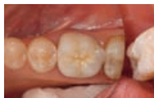
6. rezultat final