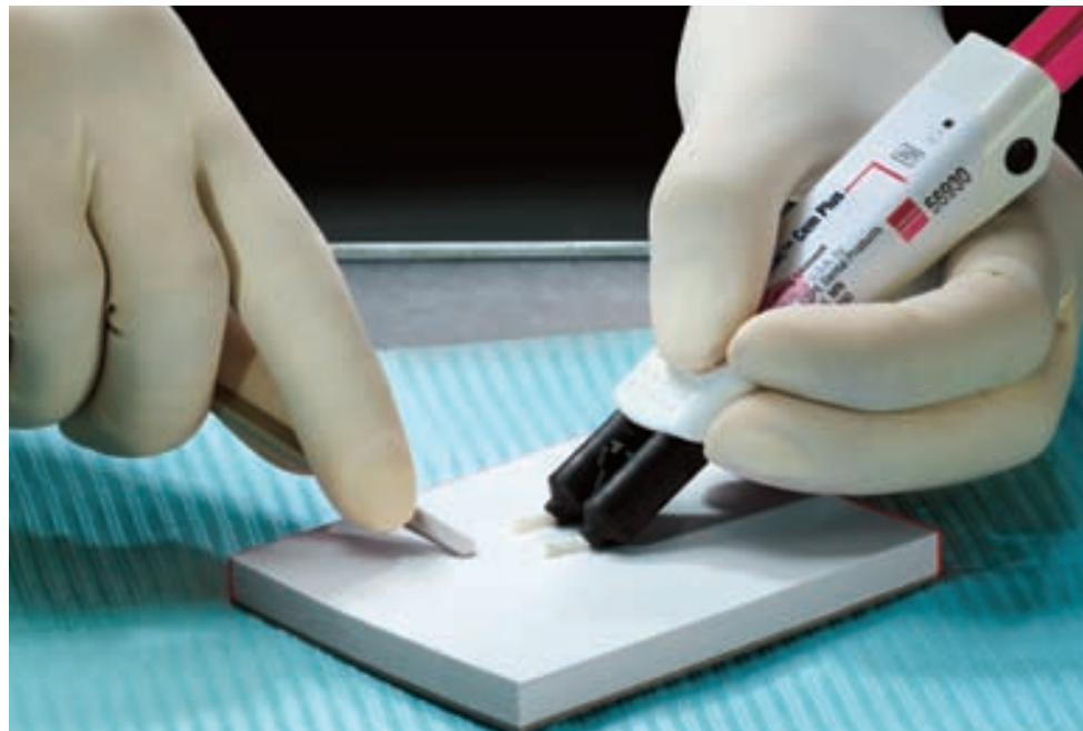
Dozare simplă din dispenser Clicker™ 1:1, amestecare ușoară

Ciment pentru cimentări definitive, sistem pastă/pastă în dispenser Clicker™