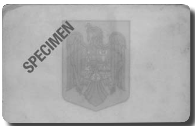
Esempio di immagine all'infrarosso

Le tipologie di documenti d'identità suddivise per Nazione di appartenenza e contenute nel database sono le seguenti: passaporti, carte d'identità, patenti di guida. Questo Database, integrato nel software 3M, è unicamente utilizzabile con i lettori 3M full page e può essere aggiornato periodicamente per garantirne la massima efficacia e sicurezza.