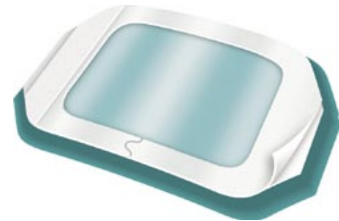
3M Tegaderm Medicazione trasparente