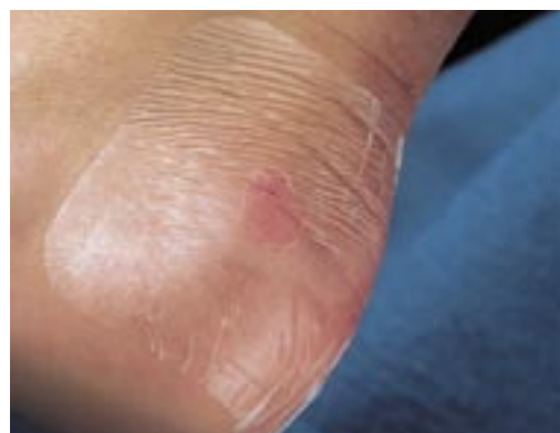
Lesione di I° stadio.