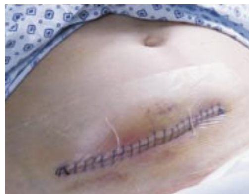
Ferita chirurgica asciutta.