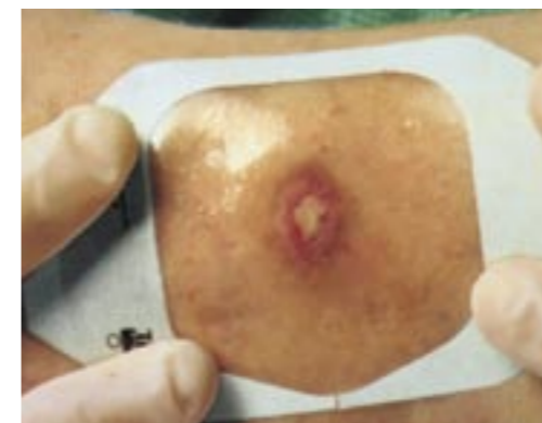
Lesione di II° stadio.