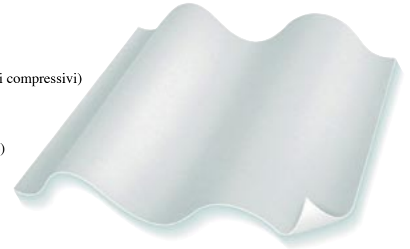
3M Tegaderm Contact Membrana protettiva non aderente