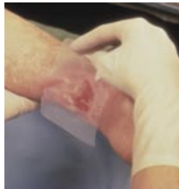
Protezione lesione aperta