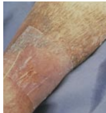
Protezione tessuto granuleggiante