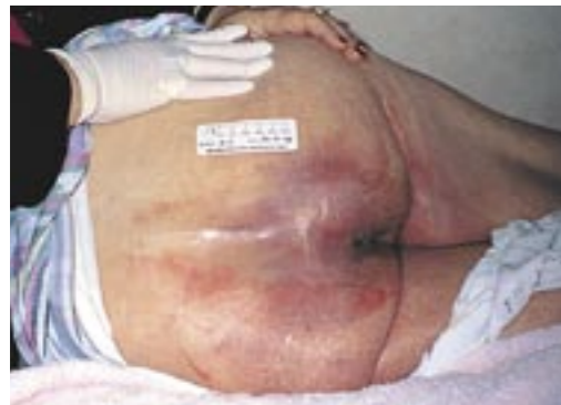
Area sacrale con moderato arrossamento, senza escoriazione.

Signora di 77 anni, con incontinenza doppia.