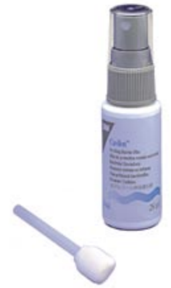
3M Cavilon Film Barriera Non Irritante

Cavilon Film Barriera Non Irritante può essere usato su adulti, bambini e neonati con almeno 1 mese di età.