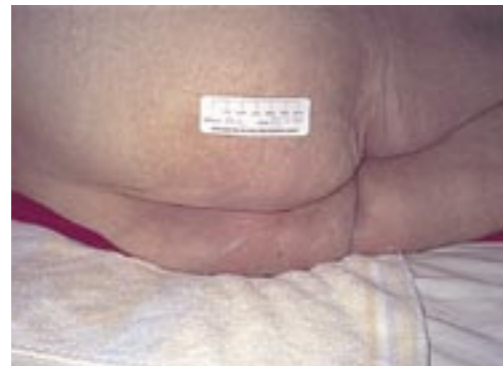
Quattro settimane dopo il primo trattamento. Il leggero arrossamento continua a migliorare dopo l'applicazione di Cavilon Film Barriera Non Irritante.