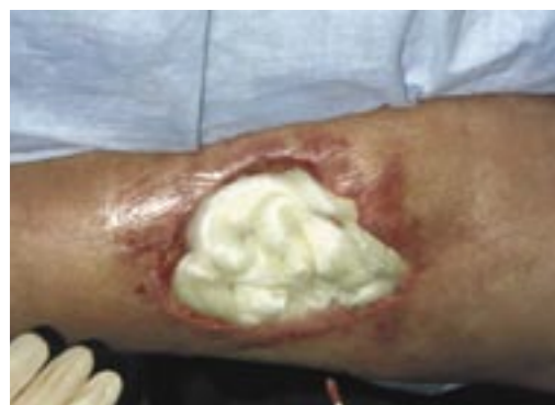
Tegaderm Alginate Nastro