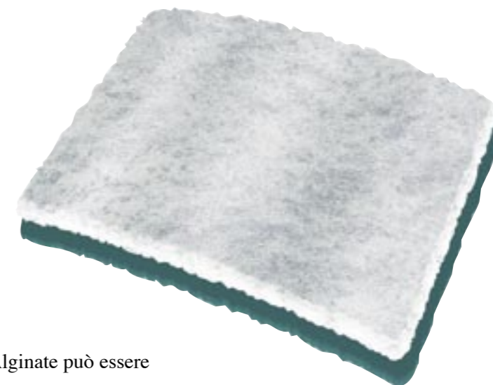
3M Tegaderm Alginate Medicazione in Alginato

3M Tegaderm Alginate non è consigliato per le ulcere asciutte, ustioni di terzo grado, ferite con escara.