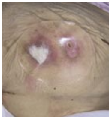
Medicazione secondaria (alginato)