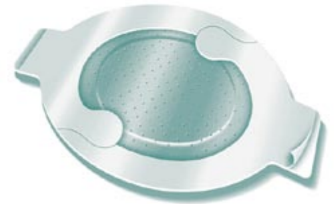
3M Tegaderm Absorbent Medicazione acrilica trasparente assorbente