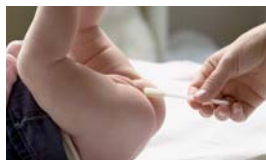
Chrání porušenou kůži při inkontinenci.