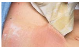
Chrání pokožku před adhezivou.