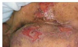
Léčba již poškozené kůže a prevence macerace