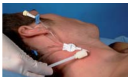
Ošetření okolí I.V. vstupů.